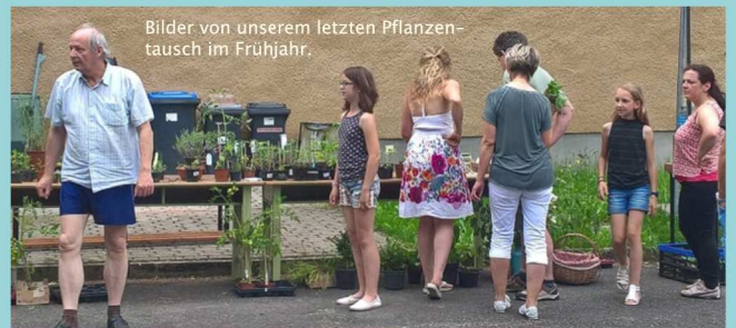
Bilder von unserem letzten Pflanzentausch im Frühjahr.

Liebe Krumhermersdorfer, liebe Gartenfreunde,